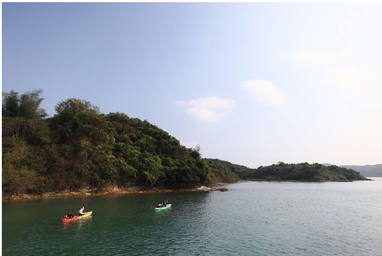
划獨木舟是探索西貢的好方式，綠蛋島近年就因此當紅了。

想多點親近自然，獨木舟訪無人島為佳。西貢的獨木舟行程多樣，目前熱門的綠蛋島，相思灣出發，慢划約 1 小時左右，沿途可欣賞到海島美景。綠蛋島是個礁石島嶼，島上只有少量植物、零設施，遊人停泊好獨木舟，即可水中暢泳。打算玩大半天的，宜在出發前買好乾糧補給。自問能駕馭獨木舟，向直立板(SUP)挑戰吧！玩直立板難度在於站板時的平衡，海下灣是最理想的遊點。海下灣為香港地質公園一部分，海灣凹陷呈 U 型，海浪相對少一點，即使是初學者或經驗玩家，都能盡興而歸。不論是獨木舟或直立板，從事水上活動有一定風險，現時坊間的旅行社都推出這些水上活動團隊行程，與其獨樂，不如眾樂，還玩得安全。