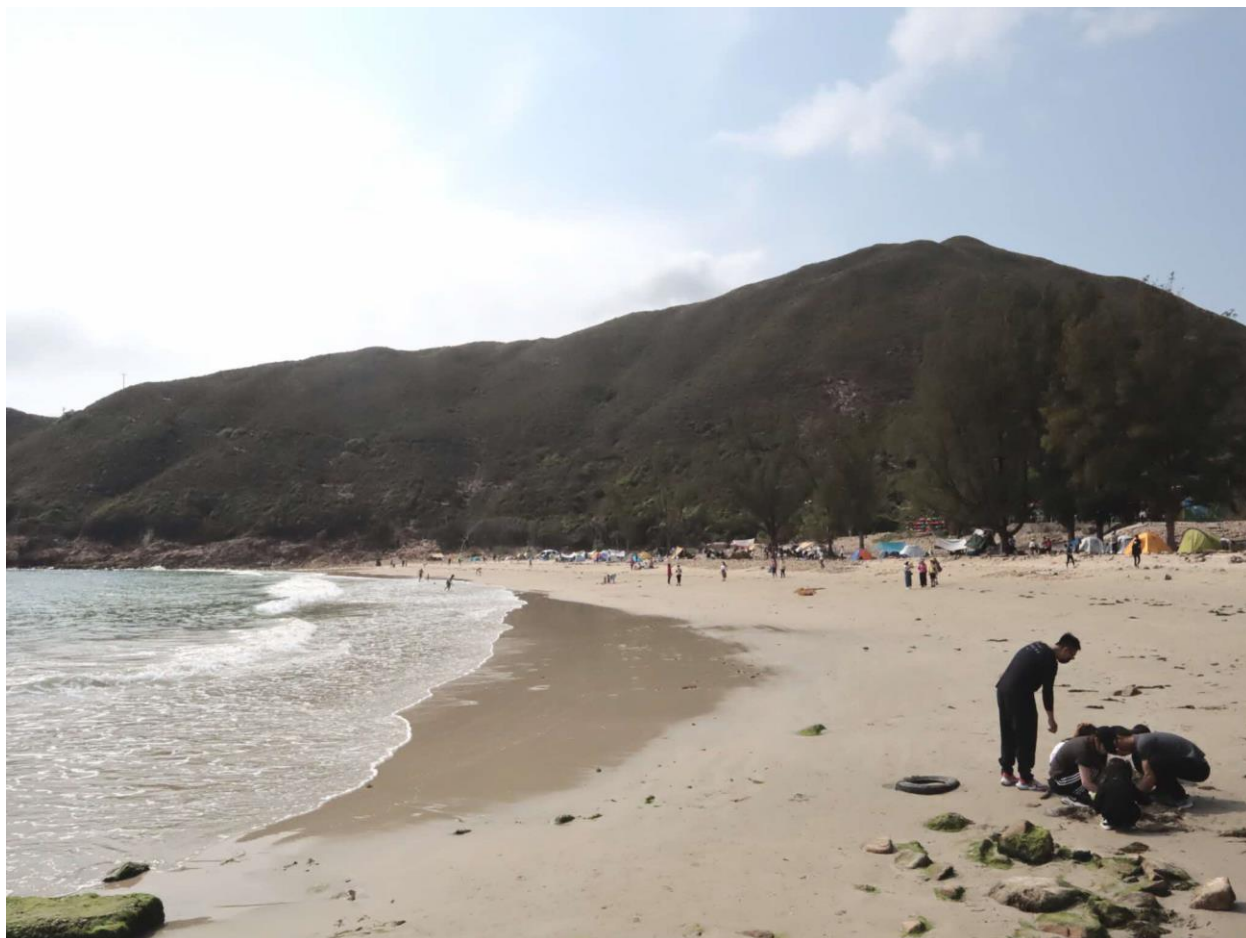
每逢周末，白腊總滿是泳客。