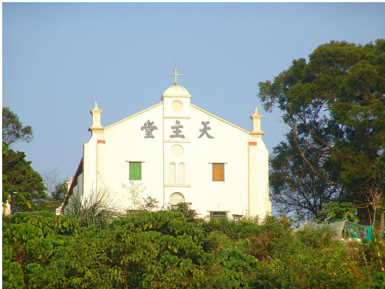
鹽日梓雖是客家村，但你可以在島上找到天主教堂。