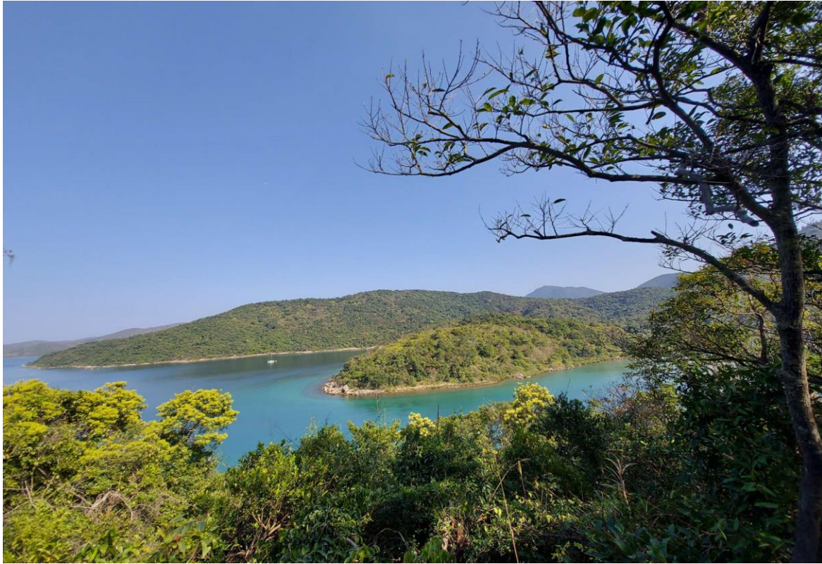
印洲塘海一帶屬秘境地帶，光用眼睛都可以感受到那清晰水色。